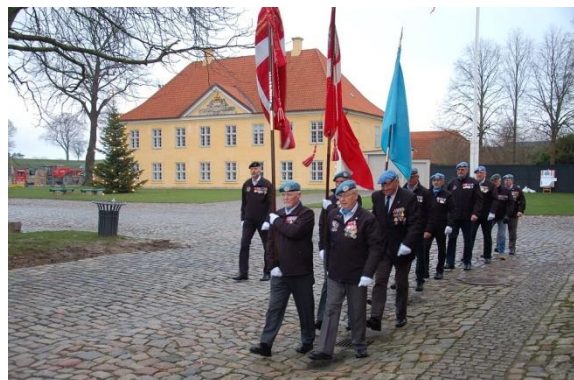
22. december Mindedag på Kastellet