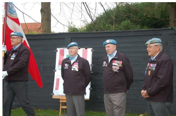
24. oktober 2019 FN Dag på Kastellet