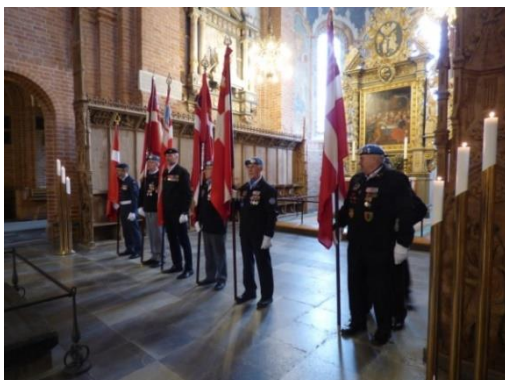
4. december i Sct. Bendts Kirke, Ringsted