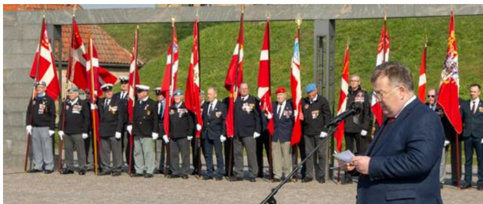
4. april 2019 NATO 70 års dag på Kastellet